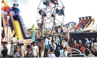
हठीले शाह दरगाह पर आयोजित मेले में झूला-स्वर्कस का आनंद लेते लोग।

संवाद न्यूज एजेंसी बजीरगंज (गोंडा)। क्षेत्र के गोंडा-अयोध्या मार्ग पर बालेश्वरगंज के पास रोजा विश्व सातार रज्जब अली हठीले शाह गाजी की दरगाह पर रविवार को लगे मेले में जायरीनों का सैलाब उमड़ा। देश के कई प्रांतों व पड़ोसी मुक्त नेपाल से हजारों जायरीन दरगाह पहुंचकर निशान व चादर चढ़ाकर दुआएं मांगीं। 200 से अधिक बरातें भी दरगाह पहुंचीं। डोल-जायरी के धुन पर नाचते-गाते लोग दरगाह पहुंचे और देहेज का सामान चढ़ाया।