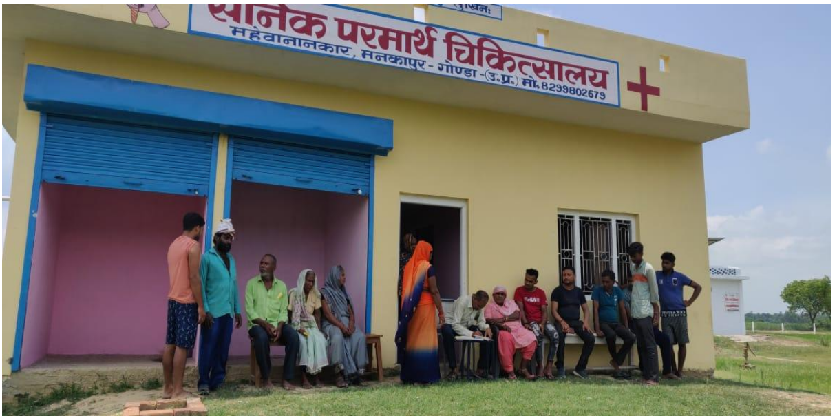
Registration of the Patients in progress

A local vernacular News Paper “Yug Jagran” published an article on the good work being done by the “Sainik Parmarth Chikitsalaya”. The services provided to the poor and weaker section of the society was well appreciated.