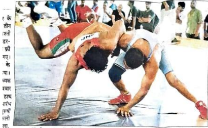
नीचिनगर के स्पोर्ट्स स्टेडियम में रविवार को जे.आर.आजमाडिया करते चलवाने। - संवाद

री चैंपियनशिप के फाइनल में खिलाड़ियों ने दिखाया दमखम