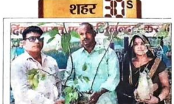
किशन बेद्यिका ने विद्यालय शिक्षक को रिपूषे।

मुजेहना में पशुओं के टीकाकरण के काम पर संकट है। 35 हजार से ज्यादा पशुओं के इलाज पर संकट है।