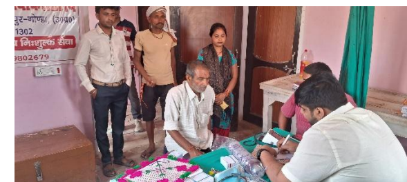
Activities Carried out at the Function