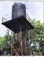
शोपीस बनी पानी की टंकी। - संवाद

मरीजों व स्वास्थ्यकर्मीयों को खरीदना पड़ता है पानी