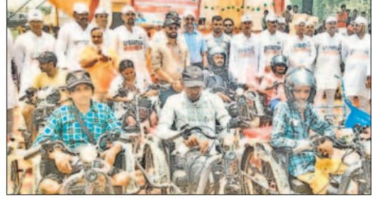
मनकापुर में आयोजित शिविर में दिव्यांगों को मुहैया कराए गए सहायक उपकरण।