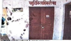
मुजेहना में पशुओं के टीकाकरण के काम पर संकट है।

आजारा, भंडादरगा। मुजेहना ब्लॉक में पशुओं के टीकाकरण के काम पर संकट है। 35 हजार से ज्यादा पशुओं के इलाज पर संकट है।